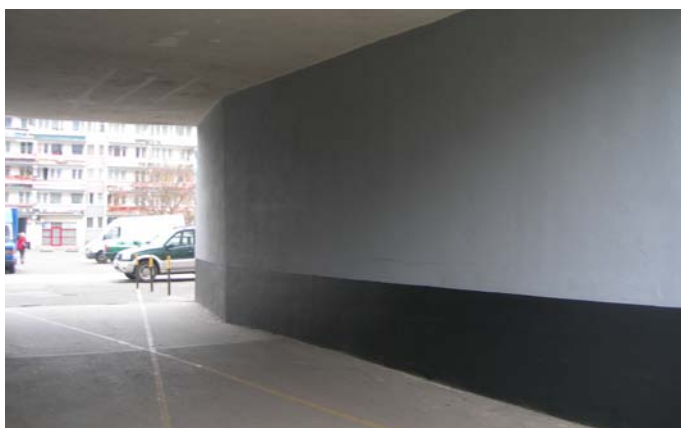
Malowanie przejść bramowych