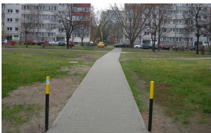
Nowa nawierzchnia chodnika, ul. Białowieska 72-74