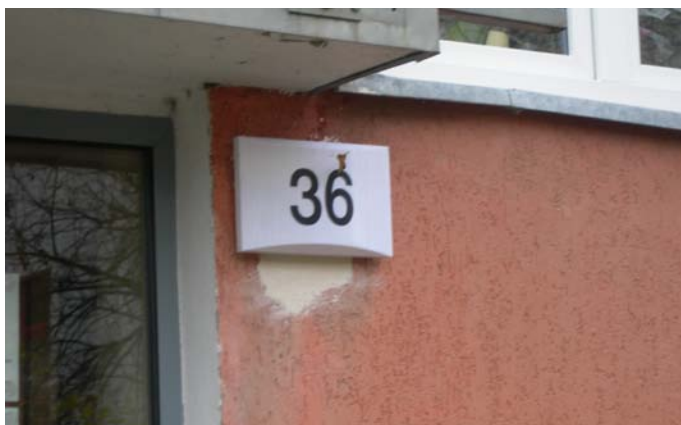
Nowa oprawa oświetlenia zewnętrznego