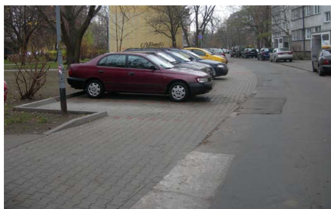
Nowy parking, ul. Białowieska 72-74