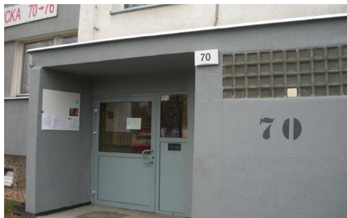
Malowanie wejść do budynków wysokich, ul. Popowicka 70